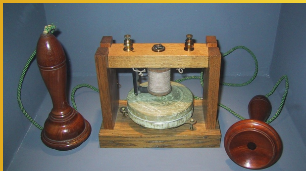
Le système Bell (1877)

Alexander Graham Bell reprit son invention pour déposer un brevet. Le téléphone fonctionnait grâce à l'électricité.